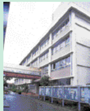
水戸キャンパスに設置された、教養研究の中核施設「大学教育研究開発センター」

月、同センターの教室に、語学学習のためのヒアリングシステムとしてアシストホーンが採用されました。学生は、社会にでてからも対応できる実用的な語学力を習得するため、熱心に授業に取り組んでいます。