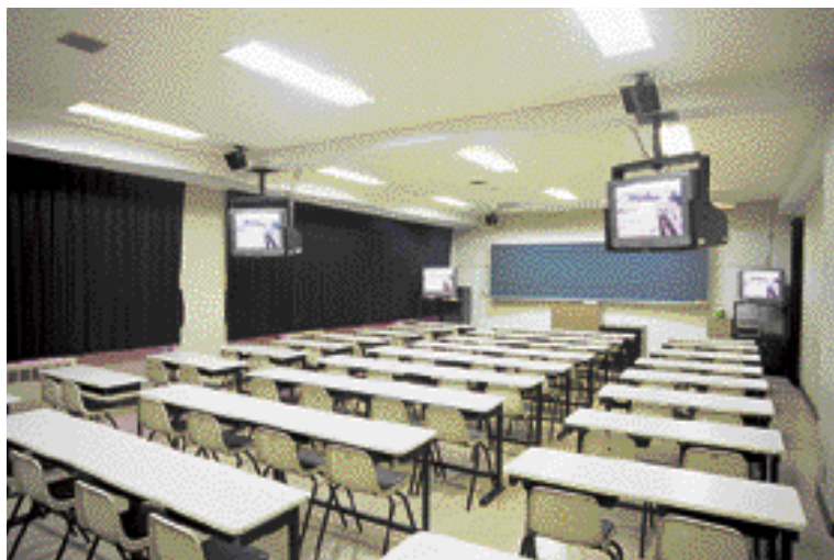
アシストホーンで、効果的な外国語のヒアリング学習を展開する語学教室