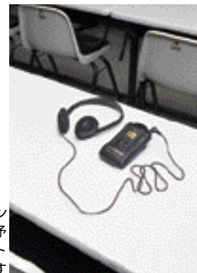
受信機とヘッドフォンは生徒の人数分と予備で、合計100セットが常備されています